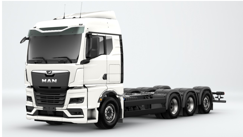
Kuva voi poiketa toisistaan

Kiitos tarjouspyynnöstänne ja mielenkiinnosta tuotettamme kohtaan.